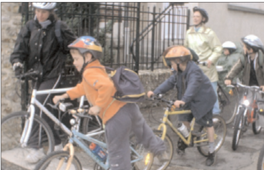
SORTIE À VÉLO.